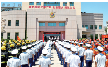
25日,青岛市消防救援局正式挂牌。

经济社会发展大局,更好担负改革发展重任,切实承担起“促一方发展、保一方平安”的政治责任,以保民平安、为民造福的实际行动,展现队伍的新气象、新担当、新作为。(观海新闻/青岛晚报/掌上青岛 记者 刘卓毅)