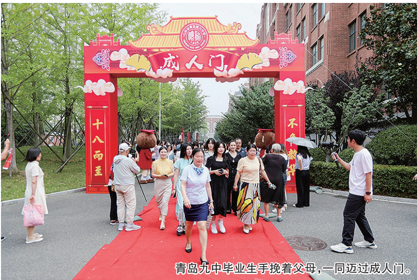
青岛九中毕业生手挽着父母,一同迈过成人门。

6月23日,青岛九中举行“礼门义路,志赴星辰”2024届毕业典礼暨成人礼,校园变身大型毕业嘉年华会场,学校设置了从“青岛九中站”开往“前程似锦站”的“毕业号”车票、巨型学生证等创意打卡装置,高三师生在院士广场留下温馨满溢的合影。