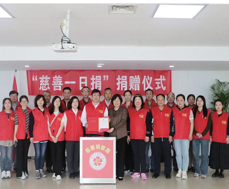
“慈善一日捐”走进慈善总会携手推动青岛慈善事业高质量发展”主题党日与会人员合照。

据悉,2024年青岛市“慈善一日捐”活动于5月13日正式启动以来,全市上下积极行动、踊跃参与、奉献爱心。截至6月21日,市慈善总会累计接收“慈善一日捐”捐款总额275.054万元。 观海新闻/青岛晚报/掌上青岛 记者 魏笑 通讯员 于晶