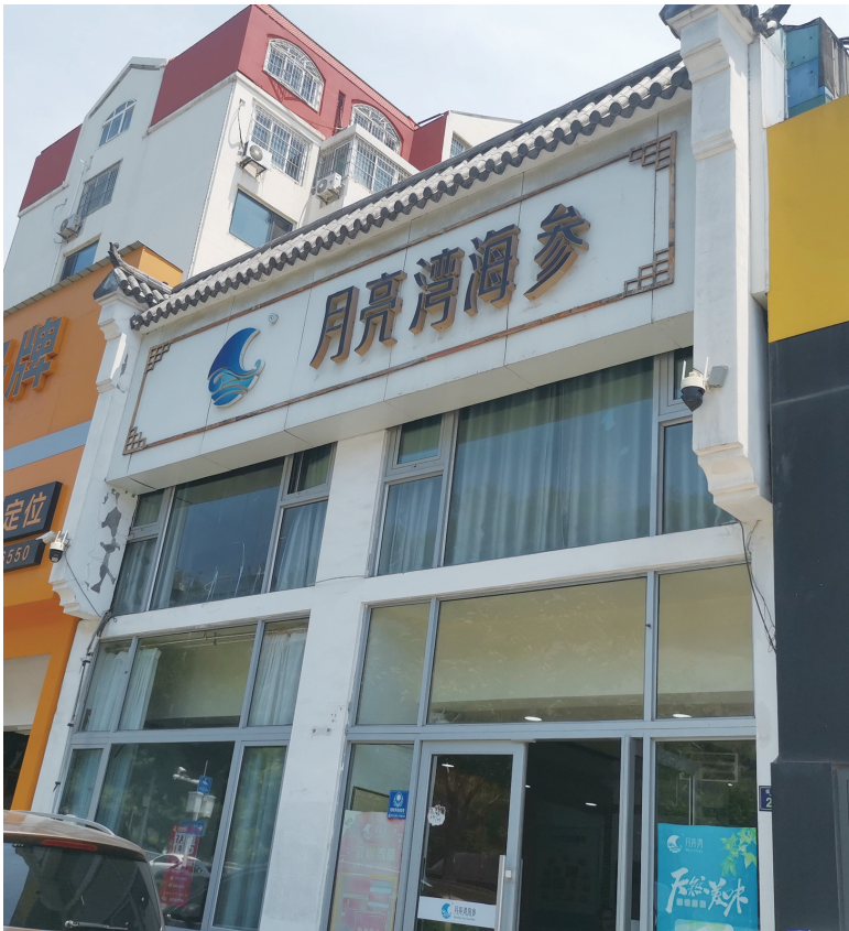
位于福州北路的月亮湾海参店。