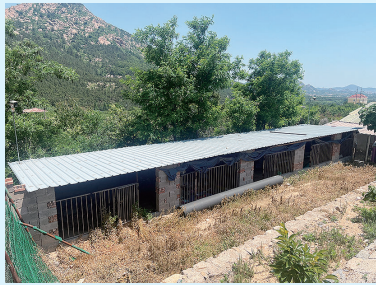
村民在山坡上私自搭建的羊棚。

本报6月17日讯 近日，崂山区王哥庄街道大桥村南山的一处200余平方米违建“羊棚”被依法拆除，赢得了周边村民的一致认可和支持。