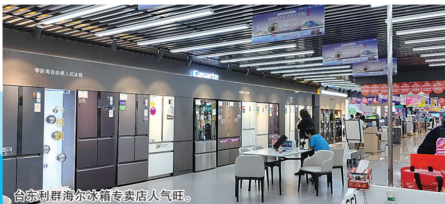
台东利群海尔冰箱专卖店人气旺。