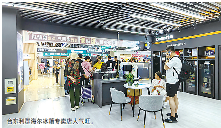
台东利群海尔冰箱专卖店人气旺。