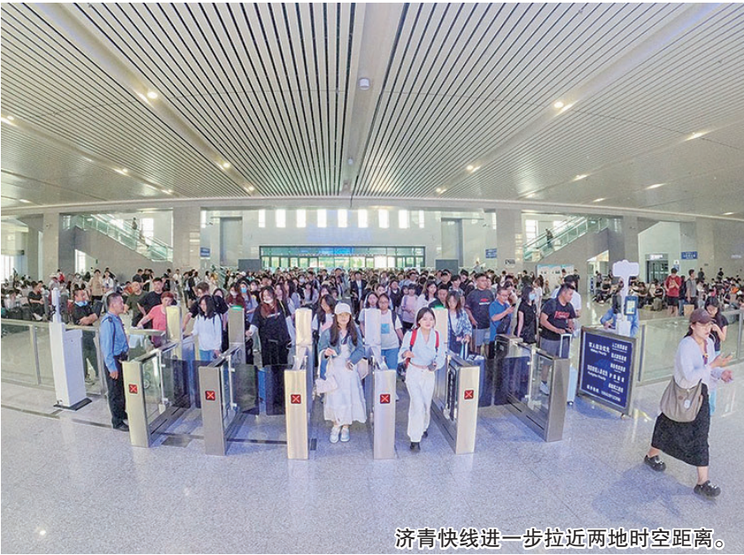
济青快线进一步拉近两地时空距离。

乘客可以有计次票、定期票、e卡通多种优惠方案选择。计次票、定期票是铁路部门推出的新型票制产品，这两种产品打破了传统客票须乘坐票面指定日期及车次的限制，持产品可在有效期内乘坐符合条件的任意车次。用户购买后，可通过席位预约和直接刷证两种方式使用。计次票(20次/90天)：旅客可在90天有效期内，乘坐20次在济青高铁线路开行的、购买产品时指定发到站和指定席别的列车。定期票(30日)：旅客可在30天有效期内，最多乘坐60次在济青高铁线路开行的、购买产品时指定发到站和指定席别的列车。计次票实行9折、定期票实行6.2折优惠措施。产品限定为济青高铁线