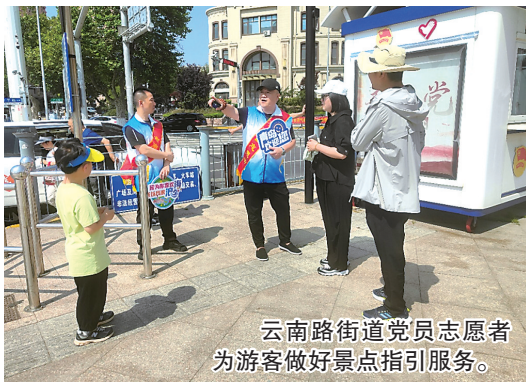
云南路街道党员志愿者为游客做好景点指引服务。