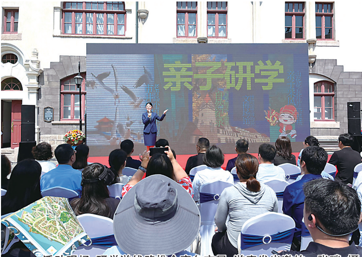
活动现场,研学游线路推介官向市民、游客发出邀约。

本报6月10日讯 日前,由市南区历史街区建设运营中心、市南区历史城区保护发展局主办的2024青岛市·市南区·上街里研学游暨历史城区文旅线路推介会在中山路城市记忆馆举行。