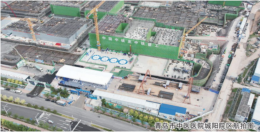
青岛市中医医院城阳院区航拍图。

6月是全国安全生产月,5日,市住建局在由中铁建工第二建设有限公司承建的青岛市中医医院城阳院区举行2024年全市住建系统“安全生产月”活动启动仪式,拧紧全市1300多个房建项目安全生产弦,同时也公开展示了一批“智能黑科技”,包括智能无人电梯、5G操控的无人塔吊、人脸识别进出系统等。