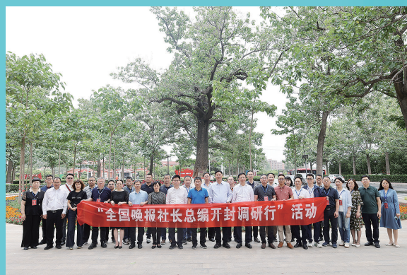
全国晚报社长总编开封调研行。