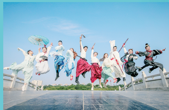
清明上河园里的古装游。