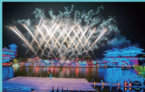
大宋·东京梦华演出。