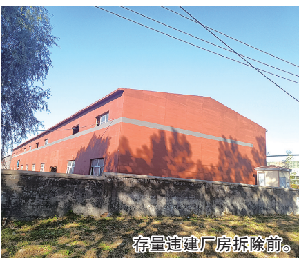
存量违建厂房拆除前。

楼层较高，厂房内大型机器设备较多，情况较为复杂。为确保按时完成拆违任务，中队依程序向当事人下达限期整改通知，开展说服攻坚，组织执法人员积极协助当事人搬离清运物品，加快清场进度，组织机械及时进场展开拆除作业，并同步完成建筑垃圾外运工作。仅用时三天，就全部完成了房屋腾空、拆除和垃圾清运工作。（观海新闻/青岛晚报/掌上青岛记者 马丙政 通讯员 傅念文）