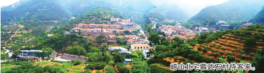
崂山北宅慕武石村待客来。

本报6月4日讯 自从去年入选第四批全省景区化村庄以来，崂山区北宅街道慕武石村的乡村四季、文旅百态吸引了更多游客前来打卡体验。