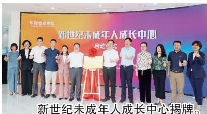
新世纪未成年人成长中心揭牌。

本报6月2日讯 2日，华青教育集团新世纪未成年人成长中心启动，青岛又添一个面向未成年人的公益服务项目。项目首次服务定为本月15日，全市未成年人和家长均可通过“青岛华青教育集团”公众号预约报名。