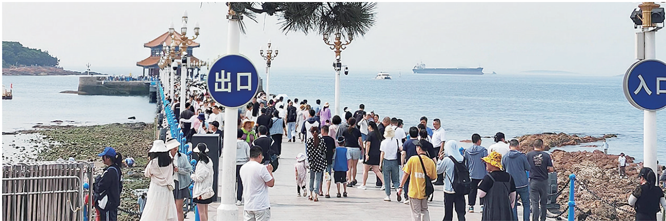
游客来青感受海边清凉。

气象部门监测显示，2日中午12时许，市区最高气温只有24℃左右，内陆胶州却达到了31℃多，南北温差非常明显。