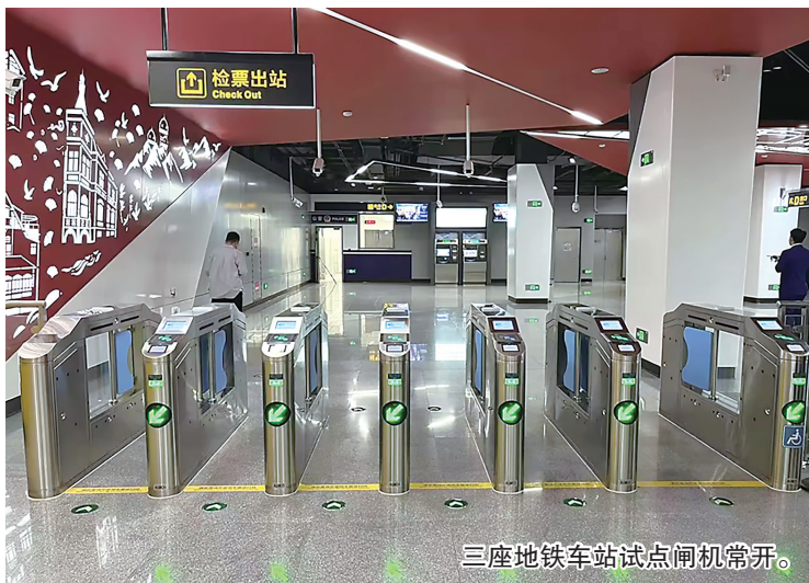
三座地铁车站试点闸机常开。

如果刷卡或扫码不成功,如何处理?两种常见情况是上次进出闸验码、刷卡未成功和超程,使用青岛地铁APP的乘客可以自助处理,其他卡或者其他情况建议到服务中心处理。市民如有疑问或建议,可以拨打服务热线55770000。(观海新闻/青岛晚报/掌上青岛 记者 徐美中)