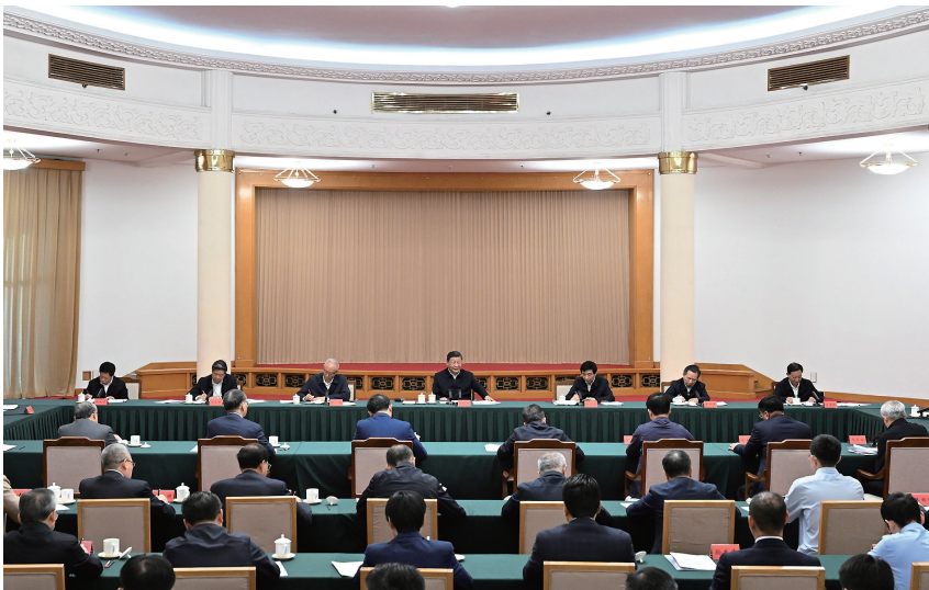
5月23日下午，中共中央总书记、国家主席、中央军委主席习近平在山东省济南市主持召开企业和专家座谈会并发表重要讲话。

解深层次体制机制障碍和结构性矛盾，不断为中国式现代化注入强劲动力、提供有力制度保障。