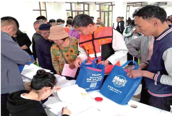
工作人员为社区居民办理交房手续。