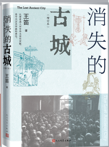
《消失的古城(增订本)》 王笛 著 人民文学出版社 2024年4月 出版