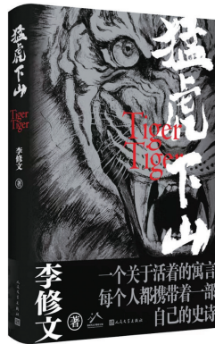
《猛虎下山》李修文 著 人民文学出版 2024年4月出版