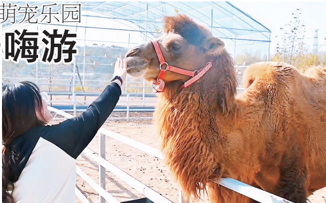
胶州市洋河镇九顶莲花山旅游度假区萌宠乐园。