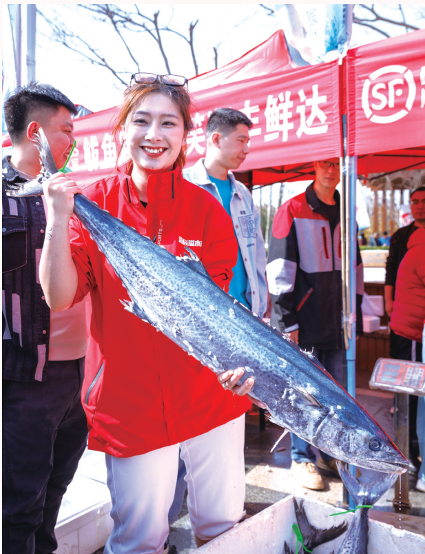
沙子口码头,市民展示18斤重的大鲑鱼。

神舟十七号载人飞船于2023年10月26日从酒泉卫星发射中心发射升空,随后与天和核心舱对接形成组合体。3名航天员在轨飞行187天,期间进行了2次出舱活动。