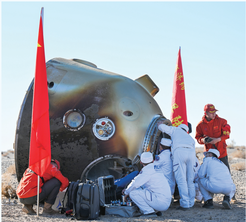
4月30日,神舟十七号载人飞船返回舱在东风着陆场成功着陆。

据新华社酒泉4月30日电 4月30日17时46分,神舟十七号载人飞船返回舱在东风着陆场成功着陆,现场医监医保人员确认航天员汤洪波、唐胜杰、江新林身体状况良好,神舟十七号载人飞行任务取得圆满成功。