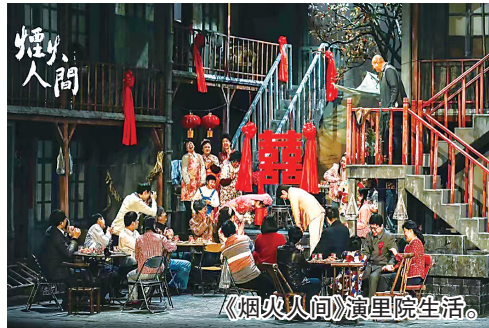
《烟火人间》演里院生活。

《柳柳州》是一部兼容古典浪漫主义与诗化现实主义、并蓄中原文化深厚底蕴和百越文化艳丽色泽的民族歌剧作品。剧中既有中原唐诗乐府和广西民族山歌的碰撞、结合与交融，又有多重时空的跨越和交织。该剧注重心理刻画、抒情色彩的唱段设置和音乐表达，在歌队、舞队、歌舞场面铺排上尽染百越文化特色，可谓雅俗共赏。