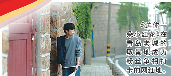
《送你一朵小红花》在青岛老城的取景地成为粉丝争相打卡的网红地。

在青岛，转角就能遇见一个剧组，多少年来这片山海被无数影视作品纳入镜头；在一部部影视作品里，跟着导演的镜头，重新发现青岛的美丽，寻味“我的城”的文旅底蕴。五一假期，就在青岛一路逛一路看风景，打卡热门取景地，不仅能勾连起关于你所爱的影视作品的回忆，还有更多“好玩”的文旅项目等你体验。