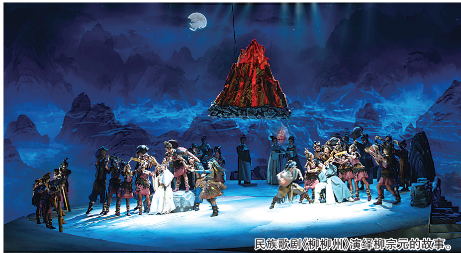
民族歌剧《柳柳州》演绎柳宗元的故事。