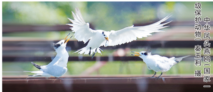
中华凤头燕鸥(国家一级保护动物)