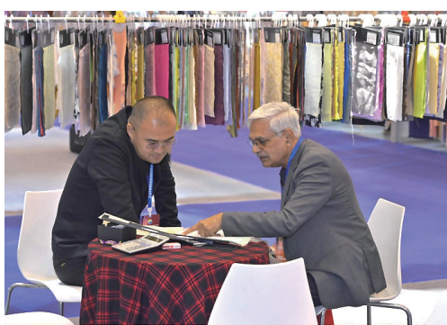
纺织企业正在与客户进行洽谈。

伴随着都市白领对运动健身需求的不断提升,运动服市场迎来爆发。lululemon、始祖鸟、FILA、安踏等一大批运动品牌快速崛起。运动服装对面料也有着特殊的要求。展会期间,专注于高端瑜伽面料的苏州威德斯