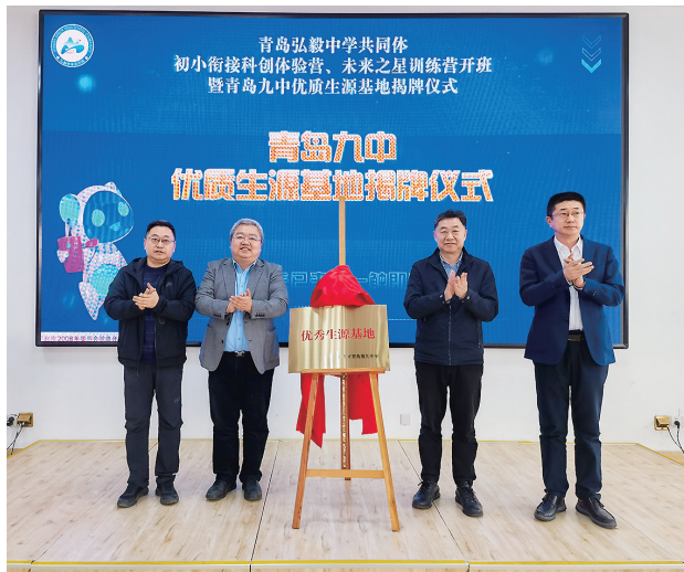
青岛弘毅中学挂牌“青岛九中优质生源基地”揭牌仪式。

本报4月11日讯 4月11日下午,“翱翔科学天空,畅游知识海洋”青岛弘毅中学共同体初小衔接科创体验营、未来之星训练营开班暨青岛九中优质生源基地揭牌仪式举行,青岛弘毅中学与青岛九中今后将深度融合,丰富小初高贯通培养模式,采取名师授课、共同教研集体备课等方式,协力打造人才贯通的成长路径,助力学子优质全面成长、成才。