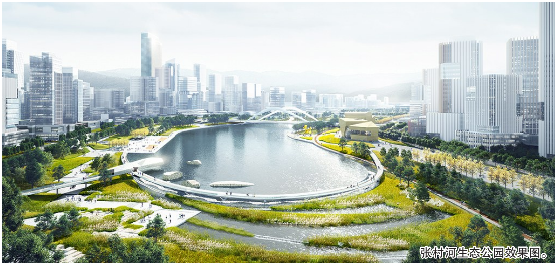
张村河生态公园效果图。

建设后,老村焕新颜,原有的趴趴房不见了,取而代之的是一栋栋拔地而起的高楼。今年年底,部分张村河南岸居民就将回迁。而在张村河生态公园规划建设过程中,项目指挥部在“新添”风景的同时,也不忘留存城市记忆。采访现场,一片空旷场地上,河道北岸两棵孤零零的大树引起了记者注意。“这两棵树都是‘老物件’,后续我们将结合施工予以保留。”不仅如此,在一片繁花掩映下的样板段,五棵雪松也被特意保留了下来。工作人员告诉记者,这五棵雪松就在原董家下庄村村委旁边,已有三十余年历史。改造过程中,不少村民都希望能保留下来。本着尊重居民意见、保留城市印记的理念,样板段特意开辟了“记忆广场”,将五棵雪松安置在河道南侧。“雪松茁壮挺拔,遮阴效果非常明显。去年夏天施工高峰期,烈日暴晒下它们成了大家遮阴好去处。”除了雪松,类似景观石块、鹅卵石等不少河道“老物件”,在改造过程中都得到了保留或者再利用。