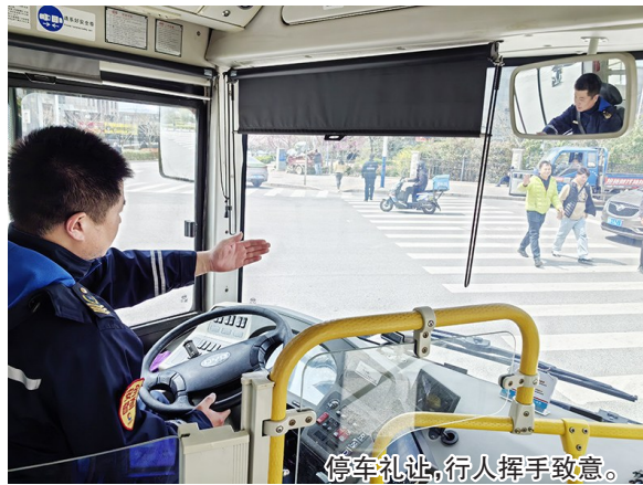
停车礼让,行人挥手致意。

“斑马线就是安全线,停车礼让既是城市文明的标志,也是安全生产的必然要求。”公交崂山公司党委书记、董事长杜广胜告诉记者,为加强行业文明建设,拧紧安全生产阀门,该公司要求所有驾驶员在行经有(无)信号灯的人行横道及路口时减速慢行,确保安全情况下低速通过人行横道及路口,有行人通行时须停车礼让,严禁高速通过、抢闯信号,让斑马线真正成为安全生命线。如今,礼让斑马线已成为该公司驾驶员的自发行为,大家不仅能够做到提前减速、提前礼让,还用文明手势向行人示意,文明行车,文明礼让在全体驾驶员