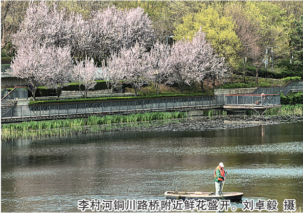
李村河铜川路桥附近鲜花盛开。