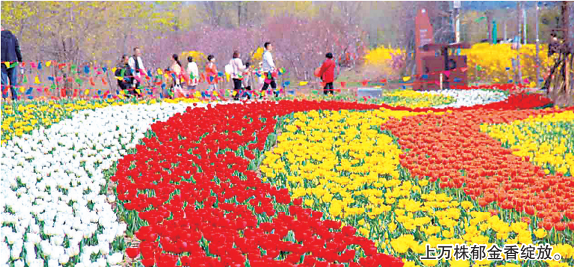
上万株郁金香绽放。

本报4月10日讯 春风贵如客，一到便繁华。近日，位于城阳区棘洪滩街道的羊毛沟花海湿地内一片绚烂，景区内上万株郁金香已经绽放，占地30000平方米十余种郁金香形成巨大的花海。