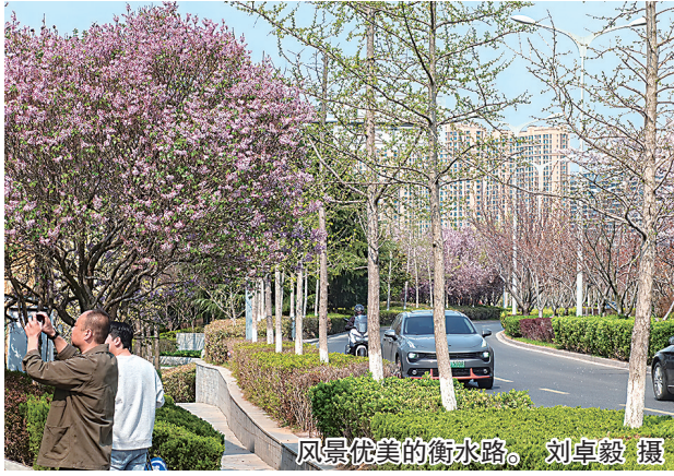
风景优美的衡水路。

100多米长的“海棠大道”，这里的海棠花正在盛开，花瓣是心形的，特别像扑克牌里的红桃图标，一片片粉霞映满了天空，一路走过，仿佛置身于梦幻仙境。李沧园林工作人员表示，海棠花期在4月，市民可乘坐地铁或者公交车到“李村公园”站下车前来欣赏。