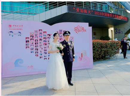
新人在海大留下珍贵的合照。