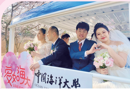
新人登车参加集体婚礼。