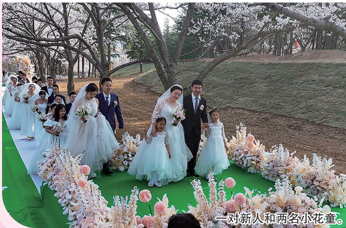
一对新人和两名小花童。