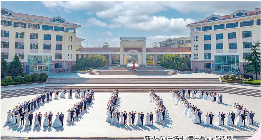
新人在广场上摆出“ouc”造型。