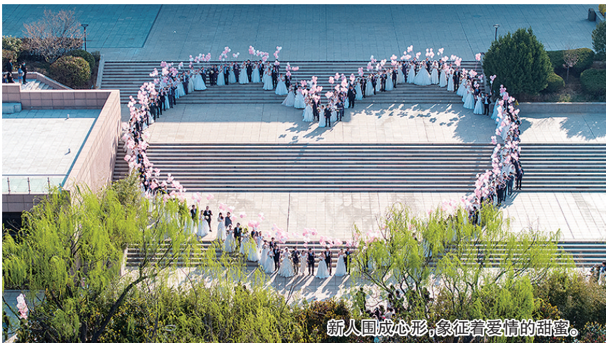
新人围成心形,象征着爱情的甜蜜。