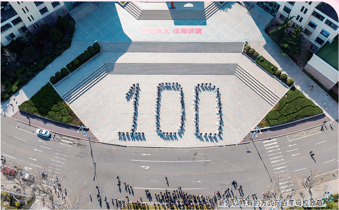
新人以特有的方式向百年母校致敬。