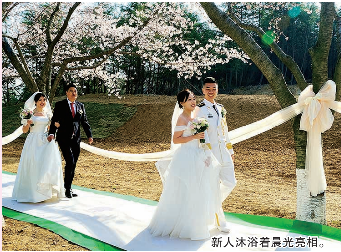
新人沐浴着晨光亮相。

人生最美好、最幸福的时刻,这是校友与母校的百年学缘,是母校与校友的世纪情缘。 据了解,参加集体婚礼的校友新人来自全国各地,扎根各行各业。此次集体婚礼营造出风清气正、勤俭节约的新风尚,不仅彰显了海大的崭新风貌,也赢得了广大校友和社会各界的热烈欢迎与高度赞誉。这场备受瞩目的集体婚礼,不仅是一场爱情的盛宴,更是一场庆祝海大建校100周年的盛典。在这里,新人们用他们的爱情见证了母校的辉煌,用他们的幸福为母校的未来增添了新的活力和希望。 记者 张琰 通讯员 张芮齐 张慧 刘邦华 实习生 范胜瑞 摄影 青岛晚报全媒体签约摄影师吕建军 李万红