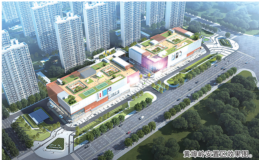
黄埠岭安置区效果图。