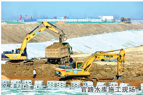
官路水库施工现场。

上合大道建设工程的快速推进,是今年胶州市持续推动城市更新建设提速增效的一个缩影。据悉,今年以来,胶州市围绕完善提升城市功能品质,坚定不移抓开工、促进度,锚定“五大新城”建设全面发力,不断提升城市活力和民生质感,年度计划投资213.07亿元的125个项目开工建设104个,开工率达到83.2%,超额完成季度目标任务。