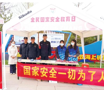
现场设置新时代文明实践志愿服务项目摊位。

大场镇以“大场十年·樱为有你”为主题，开展人文樱花系列活动，包括大场文学征集、“我把春天读给你听”线上读书活动、抖音短视频大赛等，用文字、