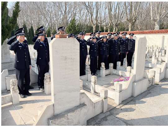
莱西市公安局民警在烈士张杰的墓前敬礼。

警、辅警到胶州市烈士陵园祭扫。在烈士纪念碑前，全体民辅警整齐列队，脱帽肃立，向革命先辈鞠躬默哀。在胶州烈士纪念馆，他们面向党旗、举起右手，重