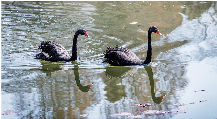
黑天鹅很快适应了环境。