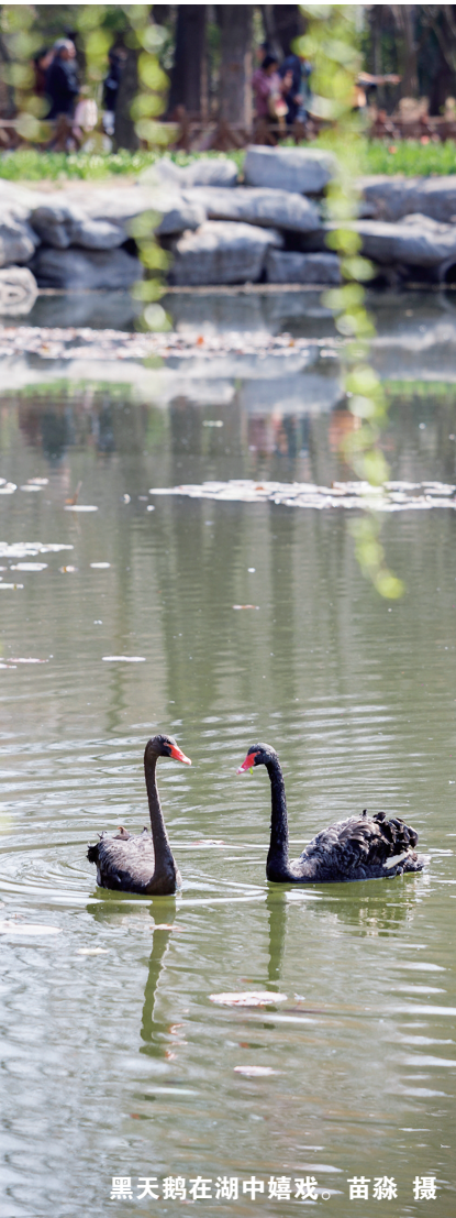
黑天鹅在湖中嬉戏。