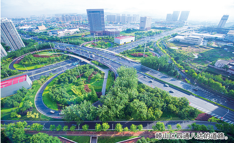
崂山区四通八达的道路。

树牢产业思维,答好创新发展卷。崂山区把四大专业园区作为以打造科技创新新高地、加快发展新质生产力的关键一招,抓好总投资400亿元的32个重点项目建设,推动更多上下游项目沿链聚合、卡位入链,带动四条产业链规