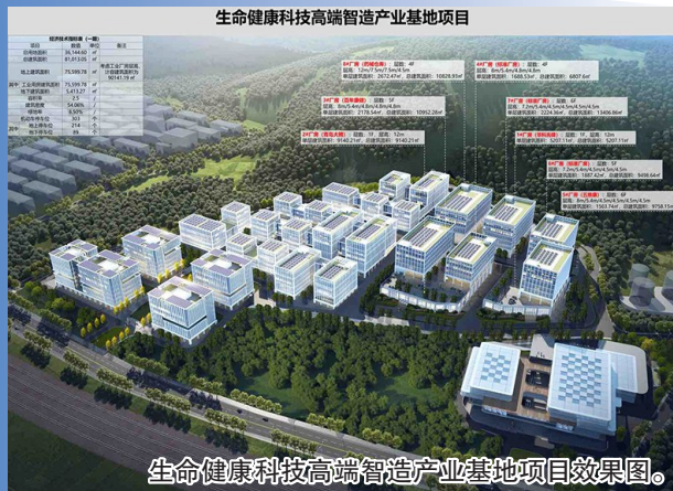
生命健康科技高端智造产业基地项目效果图。

本报3月24日讯 近日,市北区围绕生命健康科技高端智造产业基地项目一期举行“深耕新质生产力·高质量发展融媒行”系列媒体见面会。记者从会上获悉,生命健康科技高端智造产业基地项目一期已于今年2月18日完成土地摘牌,2月20日完成用地规划及工程规划许可证办理,2月29日完成土地办证及土地移交,当天完成施工许可证办理并正式开工,实现“交地即开工”。按照计划,该项目将于今年8月完工,年底投产,实现当年拿地、当年开工、当年竣工、当年投产,再现“市北速度”。