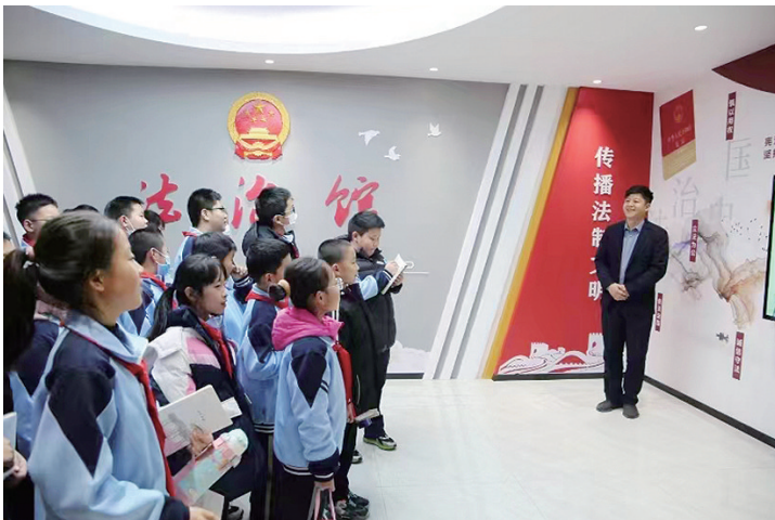
在西海岸新区隐珠街道滨海新村第三社区,志愿者们给孩子们带来精彩的法律知识讲座。