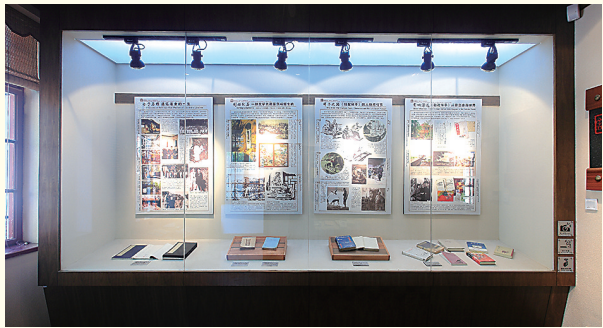
博物馆里关于《骆驼祥子》的展示是一大特点。

2023年,骆驼祥子博物馆接待了26万人次的游客。“博物馆开馆第一年,游客不足万人,现在博物馆已经成了‘网红打卡地’。”王咏馆长说,这座始建于上世纪20年代的老建筑,因为老舍在这里写下《骆驼祥子》成为“老舍故居”中最为有名的建筑之一,而从“故居”到博物馆,如今的黄县路12号,已经成为在青岛打通时空,走近老舍世界的最佳通道。