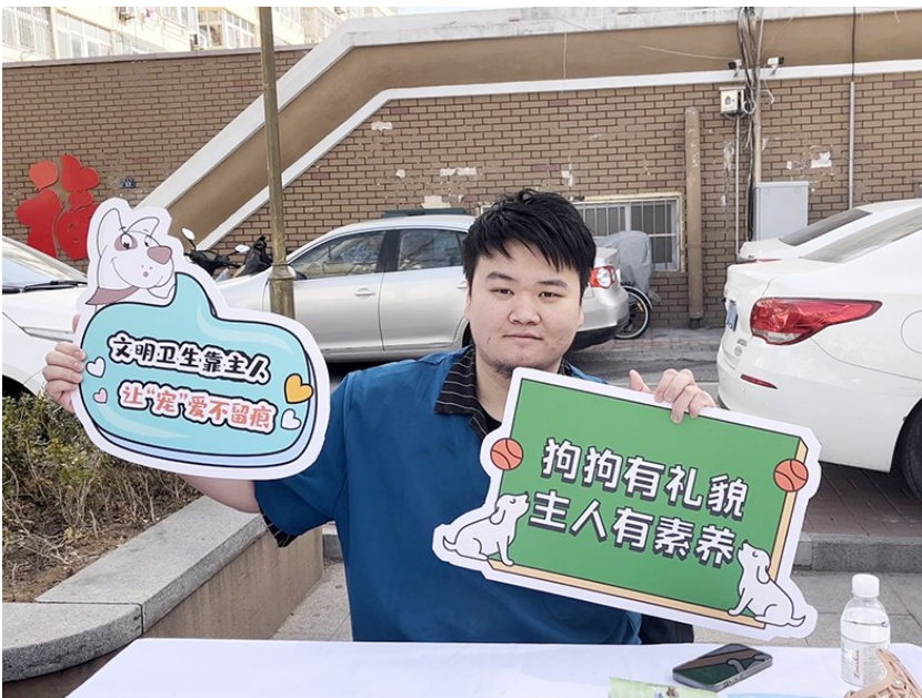
为犬只提供免费体检服务的志愿者现场宣传文明养犬。

活动中,市南区综合行政执法局和青岛市公安局市南分局对《青岛市养犬管理条例》进行了详细解读。根据《青