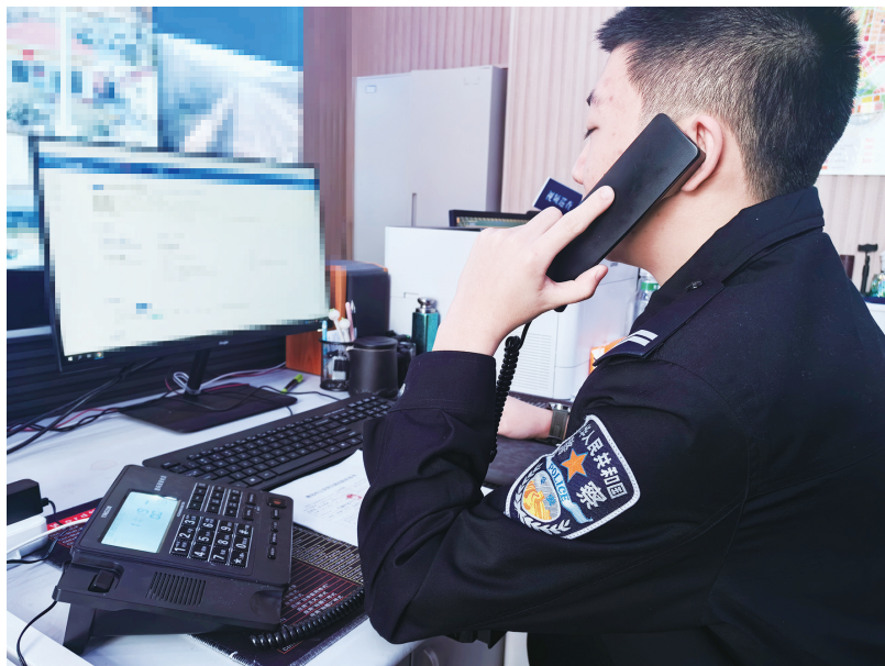
当面劝阻前，辽阳东路治安派出所民警先致电劝阻。

2023年，济南的李女士在二手交易平台售卖纸尿裤时，骗子假扮买家称订单被冻结，发送截图让李女士联系截图里的客服解冻。李女士联系骗子假扮的客服后，向对方支付了70000元；2024年，抚顺警方打掉了一个二手转让平台上的“到手刀”团伙，买家在确认购买商品的情况下，收到商品后故意制造商品损坏的假象，借机要求卖家进行补偿，利用不少卖家“认倒霉”的心态，借此谋划骗局。