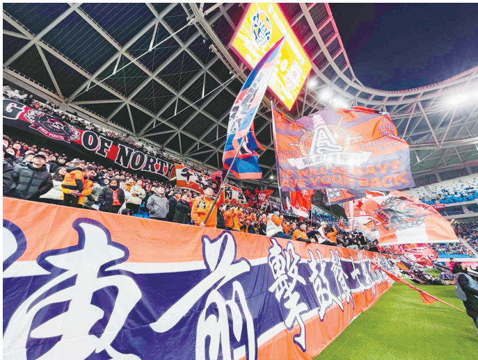
海牛球迷为球队助威呐喊。

青春足球场涌入21600余名球迷,西海岸大学城体育场涌入近11000名球迷,天泰体育场涌入近4000名球迷……随着新赛季的中超、中甲联赛全面开启,10天时间,岛城3支球队分别迎来主场首秀,共吸引了近4万名球迷走进球场。随着春天的到来,青岛的球市热度也正在升高。与此同时,青岛也在抓住这波“足球流量”,盘活赛事经济这盘棋。