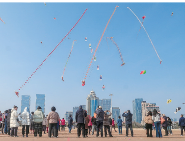
五条巨龙风筝扶摇直上,气势豪迈。

本报3月12日讯 10日,青岛市风筝协会在石老人海水浴场盛大举办“二月二 龙抬头,巨龙腾飞,祈福岛城”大型风筝放飞表演。活动现场,五条巨龙风筝扶摇直上,气势豪迈,吸引了众多市民游客驻足观看。