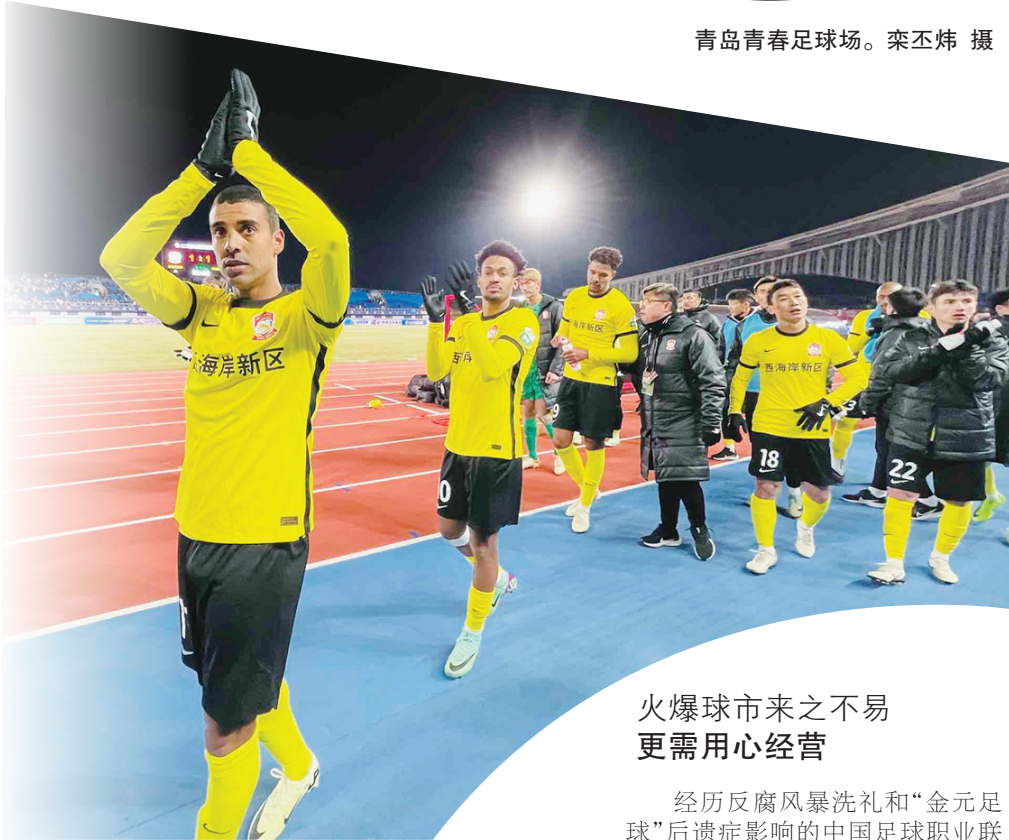
青岛西海岸队首个主场比赛赛后谢场。