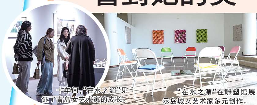
十年间，“在水之湄”见证了青岛女艺术家的成长。