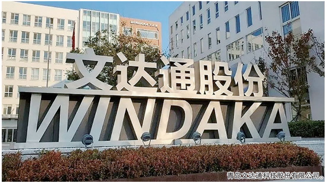
青島文達通科技股份有限公司。