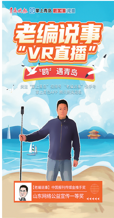
《老编说事》VR直播新栏目上线。

在科技创新的浪潮中，虚拟现实（VR）技术正逐渐渗透到人们的日常生活中。2月28日，青岛晚报全媒体《老编说事》团队在五四广场举行了一场别开生面的VR直播活动，记者通过先进的VR设备，将现场景象360°展现给直播间观众，让观众与海鸥近距离接触，体验与众不同的自然观察之旅。