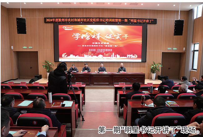
第一期“明星书记开讲了”现场。

2019年初，胶州市开始筹划建设镇级党校，在深入调研的基础上，在青岛市率先出台了《胶州市基层党校建设运行指导标准》，为基层指明了工作方向。各镇街盘活利用好镇街合并腾退的办公用房、合点并校闲置的校舍，以