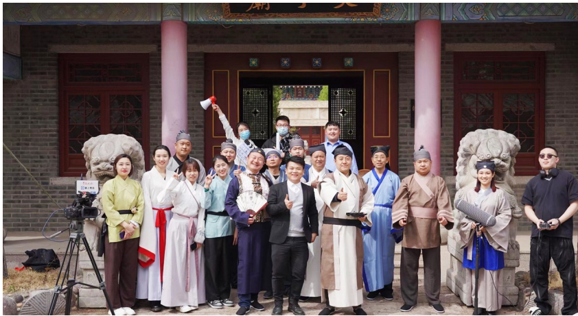
海螺视频团队拍摄税务主题古装穿越剧《信息化办税,财务就是如此简单》剧照。

掌控传媒海螺视频团队是青岛晚报全媒体融合发展打造的新锐团队。团队分为拍摄组、直播组、后台技术组、设计组,采用盒子、帽子设备开展直播+图文+航拍+定制级短视频等多路全媒体全方位报道,近期更将推出高新VR直播视频。团队原创拍摄制作的微电影《礼物》荣获2021年山东省公益