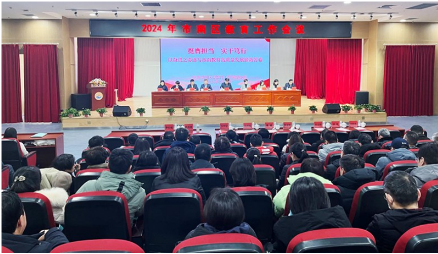
2024年市南区教育工作会议在青岛金门路小学举行。

为率先实现优质资源倍增,市南区将探索建立与出生人口、新户籍政策匹配的教育资源调配机制,全力保障学位供给,预计新增班级33个、学位约1500个。要在优化办学模式上求突破,拓展与2所高校、3所优质高中合作办学路径,扩大紧密型教育集团覆盖面,打造贯通培养新模式。