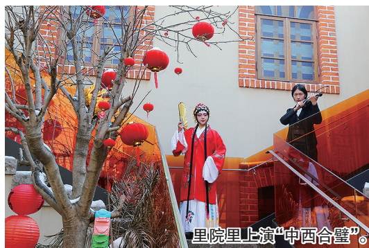
里院里上演“中西合璧”。

为此，元宇宙剧本游设计了亲子线“梦想家”和成人线“真传传”两条故事线索。“梦想家”的主线是孩子们通过找寻老奶奶的里院记忆，重温旧时光里的美好；而“真传传”则以京剧的传承为主线，最终用一个美好的爱情故事，呈现