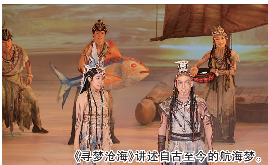
《寻梦沧海》讲述自古至今的航海梦。

“海有多深，海有多远，我要去冒险……”《寻梦沧海》以“航海”为主题，以史前少年贝、秦国冒险家徐