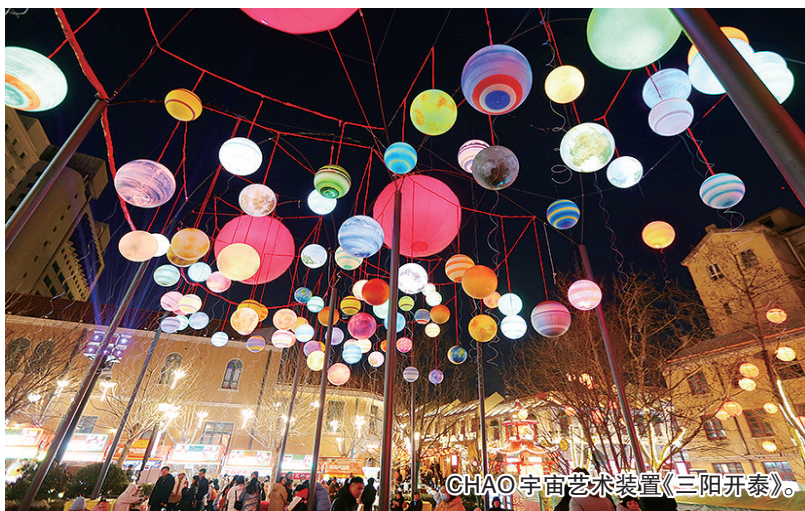
CHAO宇宙艺术装置《三阳开泰》。

以元宇宙沉浸式剧本游的形式，进入里院的百年历史。在萝卜·元宵·糖球会把民俗味、烟火气于老城再度点燃的同时，“CHAO起大鲍岛·一天一百年”元宇宙沉浸式剧本游活动，在糖球会中以“平行宇宙”的视角，带着游客市民玩了一把新潮。