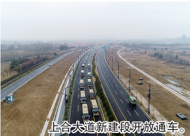
上合大道新建段开放通车。

新春伊始，胶州市于2月16日、18日先后举办上合大道建设项目春节复工仪式、上合国际枢纽港新城基础设施及配套工程（一期）项目开工仪式，为推动年度城市更新建设攻坚任务迅速起势营造浓厚氛围。两个项目的大干快上，体现出胶州市正以坐不住、等不起、慢不得的紧迫感加快推进城市更新和城市建设，全力为胶州市这座使命之城导入新动能、焕发新生机。