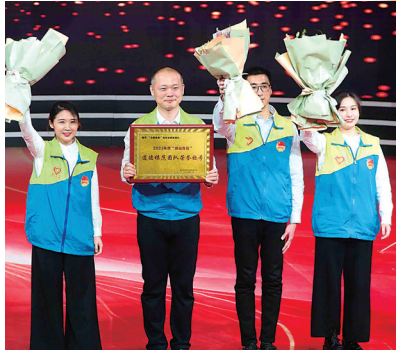
“竞展青春”青年志愿者团队