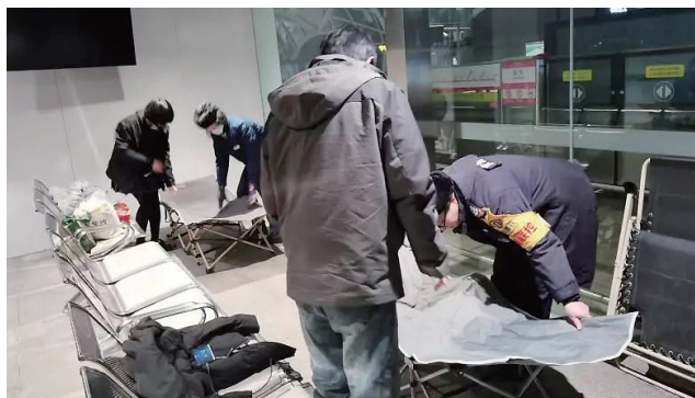
►地铁开放休息室供乘客休息。