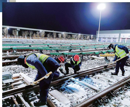
►顶风冒雪检修轨道。