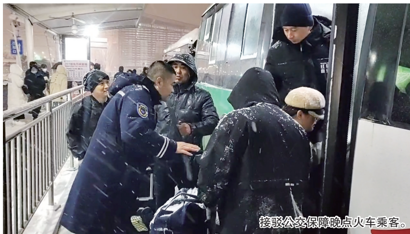
接驳公交保障晚点火车乘客。