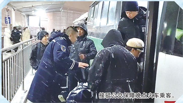
接驳公交保障晚点火车乘客。

正值春运返程高峰,暴雪、冻雨天气却不期而至。我市交通部门启动二级应急响应,面对晚10时后仍有7600余名旅客陆续抵达机场和火车站的情况,协调地铁延时运行提前开行、公交应急接驳,及时疏散旅客,另一方面为自愿驻留人员设置安置区开放就餐区,一系列暖心举措,确保旅客安全回家的同时,也彰显着城市温度。