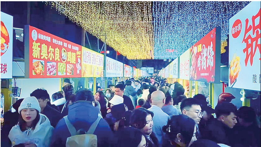
胶州桥头夜市很火爆。

以“楼宇经济”为主攻产业,以现代服务业为关键抓手,瞄准深圳福田CBD125座“亿元楼”标兵,推动特色楼宇集聚化、园区化、功能化布局。