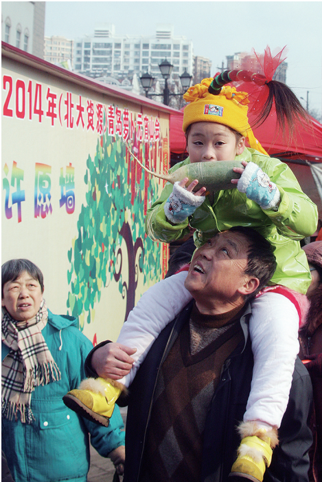
摄于2014年的“萝卜妹”。