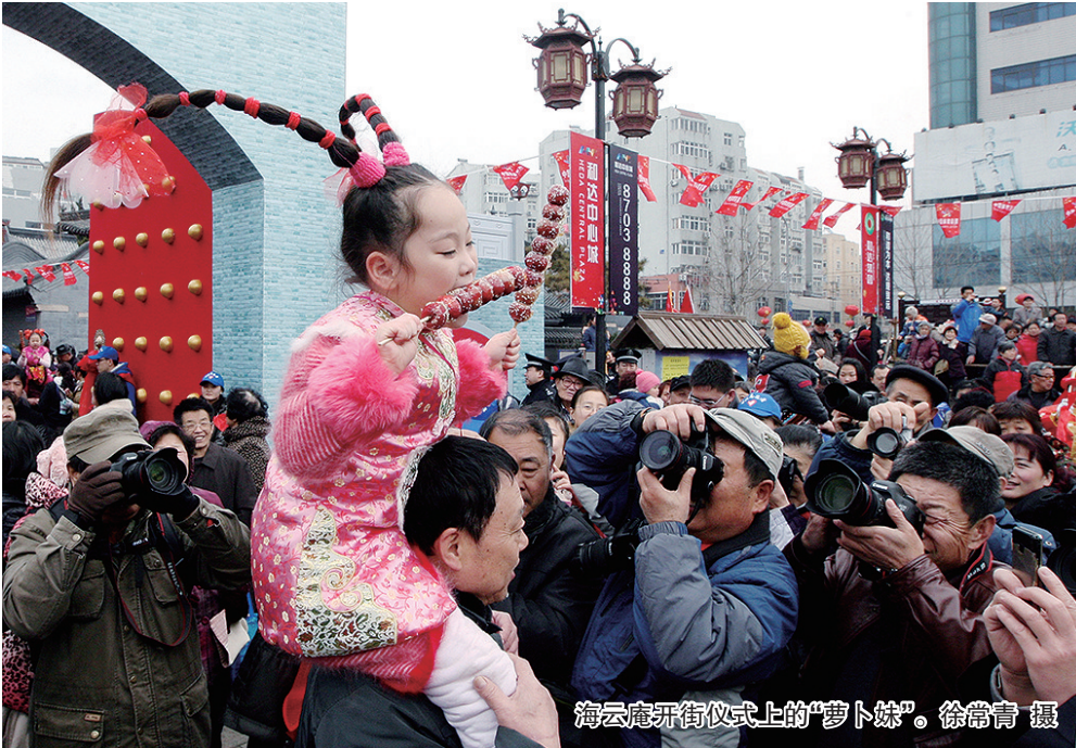
海云庵开街仪式上的“萝卜妹”。

云庵开街仪式、萝卜会上的雕刻大赛等。因此每每亮相,爷孙俩都被众人簇拥,像是节会的“火种”,走到哪都能瞬间“点燃”哪里的人气,成为节会上最受欢迎的红人。