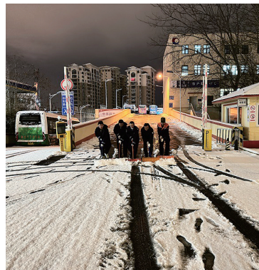
保障市民出行及时清扫积雪。

本报2月20日讯 19日夜间至20日清晨，受低温降雪影响，我市部分路面出现结冰现象，给市民早高峰出行带来了不小困扰。以雪为令，岛城公共交通各突击队凌晨出击、迅速行动，为市民安全出行铺就了一条“暖心路”。