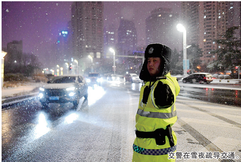
交警在雪夜疏导交通。

交警提醒，近期青岛市仍有强降雪天气，请大家尽量选择公共交通出行。驾车出行要合理规划行车线路，行车要牢记“降速、控距、亮尾”，打开雾灯、示廓灯、危险报警闪光灯，保持与横向、纵向车辆的安全距离。行驶中尽量避免随意变道、强超强会、急刹急转，以防发生危险。行经人行横道时，一定要注意观察过路行人，提前采取避让措施，确保安全。（观海新闻/青岛晚报/掌上青岛 记者 刘卓毅）