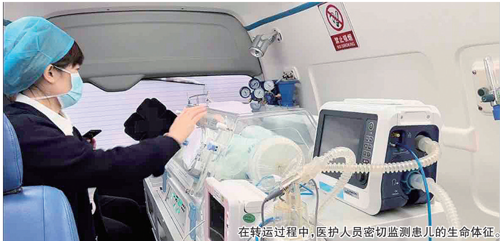
在转运过程中，医护人员密切监测患儿的生命体征。

本报2月20日讯 20日，降雪天气打乱了许多人的出行计划，青大附院市南院区新生儿科的医护人员接到了一例危重早产儿的转运任务，出生仅三天的早产儿随时有生命危险。青大附院新生儿科医护团队立即评估路况，冒雪出发，紧急成功完成转运任务。