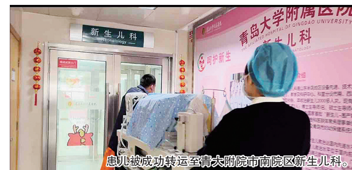
患儿被成功转运至青大附院市南院区新生儿科。