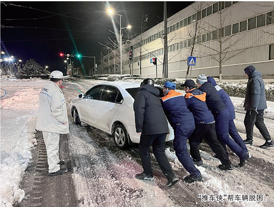
“推车侠”帮车辆脱困。