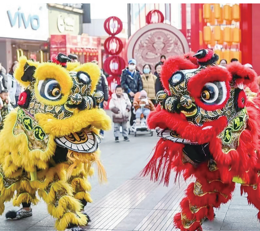
台东步行街上的舞狮表演。