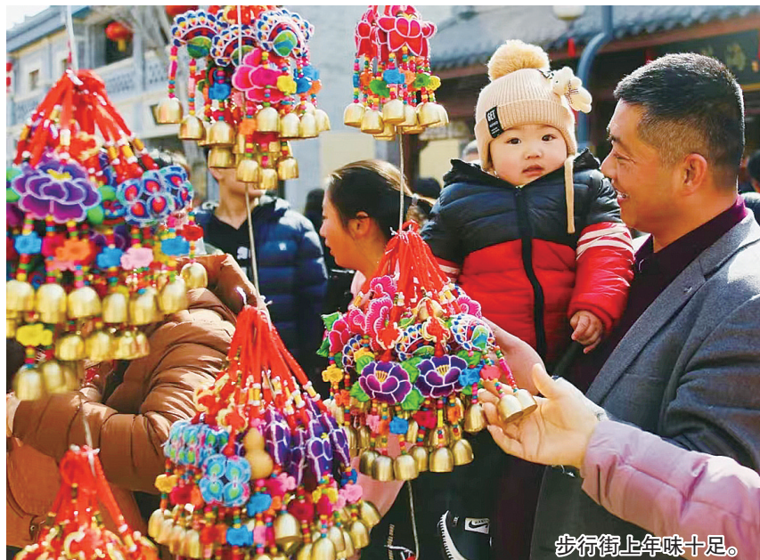
步行街上年味十足。

步行街作为一座城市标志性的商业街区,它所代表的不仅是一座城市的商业经济,更是这座城市的历史与文化。几乎每个城市都有代表性的步行街,正如王府井之于北京,南京路之于上海,宽窄巷子之于成都,台东步行街之于青岛。上世纪九十年代,步行街曾是各大城市最火爆的商业载体,它不仅是市民休闲娱乐的首选,更是游客了解一座城市的窗口。然而,伴随着综合性购物中心的兴起,步行街逐渐走向沉寂。近年来,伴随着城市更新行动的加快实施和商业业态的不断调整,步行街开始重回大众视野,并逐渐成为城市“顶流”。今年春节小长假期间,中山路、台东等步行街以节兴商聚势,创新消费场景,开展丰富多彩的促销促销活动,成为广大市民游客休闲购物的热门打卡地,各重点街区客流量、营业额同比去年均实现大幅增长,表现出强劲的吸金能力。