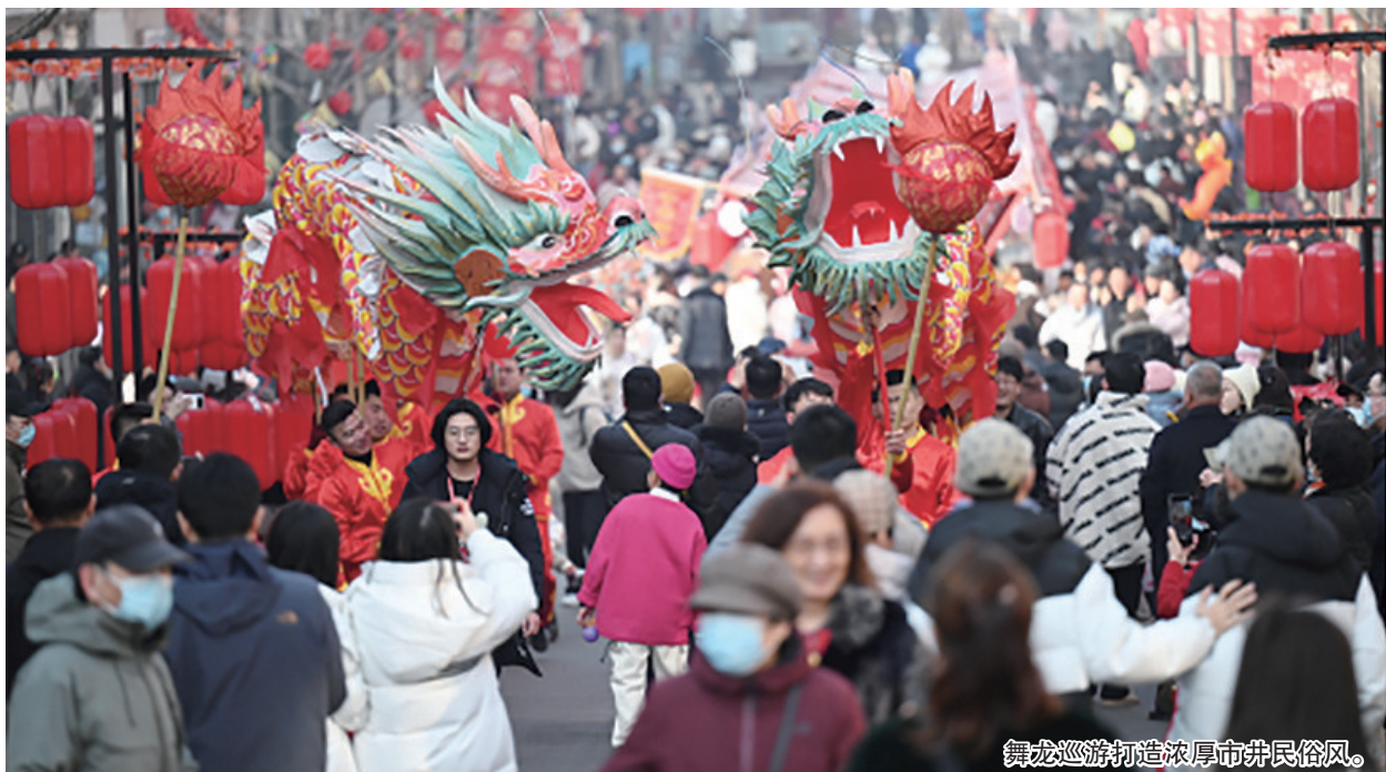
舞龙巡游打造浓厚市井民俗风。