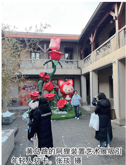
黄岛路的阿狸装置艺术展吸引年轻人打卡。