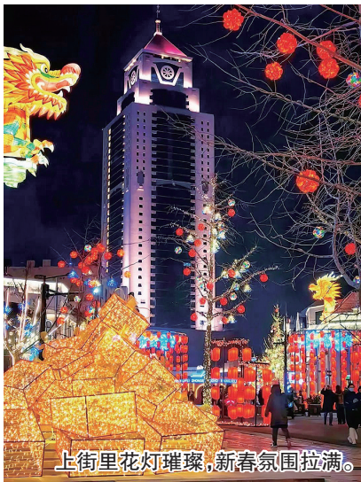
上街里花灯璀璨，新春氛围拉满。

当百年广场聚拢人潮随演艺律动，当百年老街摆出火锅长桌夜宴，当百年里院点亮时尚艺术装置……第二届新春逛街里节启幕的一刻，市南老城以中山路为轴线，以游市集展览、赏演艺花灯、品美酒美食、愿祈福旅拍为主要活动内容，打造出活动区域最广泛、演艺形式最多样、互动玩乐最新颖、氛围营造最沉浸的全新体验。而经历了上街里·啤酒节、上街里·逛春天节、青岛（市南）庭院艺术节等一系列活动的厚积蓄力，在新春又一场节庆中，上街里正在实现从引流到引领、从“清流”到潮流的蜕变，自人潮涌动中释放出自己的“超级声量”。