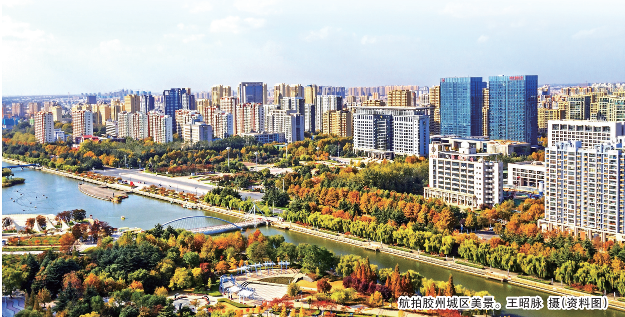
航拍胶州城区美景。